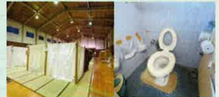
避難所のトイレのあり方を考えます。