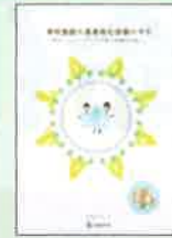
学校施設の長寿命化改修の手引 (文部科学省)