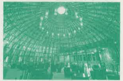
Vo Trong NGHIA / Wind and Water Bar

1976年ベトナム、クアンビン省生まれ。2002年名古屋工業大学社会開発工学科卒業。2004年東京大学大学院工学系研究科社会基盤学専攻修士課程修了。2005年同大学博士課程中に東京大学総長賞を受賞。ホーチミン市に、2006年ヴォ・チョン・ギア・アーキテクツ (VTN)、2010年合弁会社ウィンド・アンド・ウォーター・ハウス (wNw) 設立。2011年VTNハノイ支部を開設。2015年シンガポール工科大学客員教授。AR HOUSE AWARD (2014)、ARCASIA BUILDING OF THE YEAR (2014) ほか、ベトナム国内外で受賞多数。