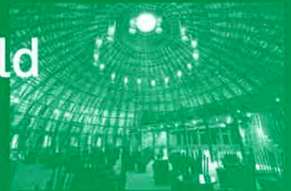
Vo Trong NGHIA / Wind and Water Bar