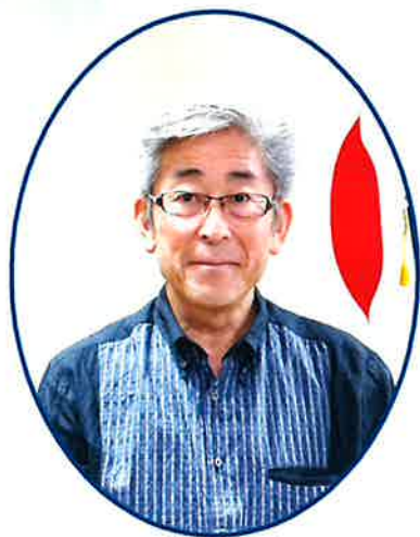
【講師】宮川 学氏 外務省沖縄担当大使